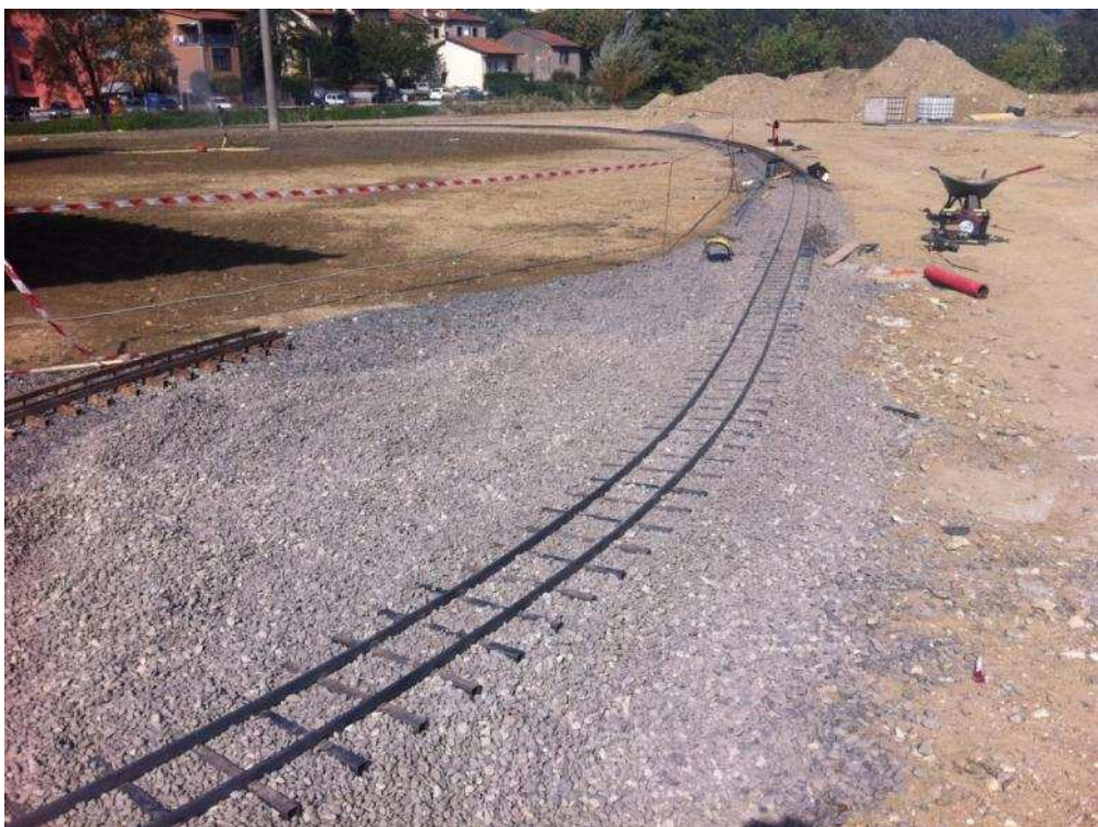
Figura 17 Tratto già inghiaiato