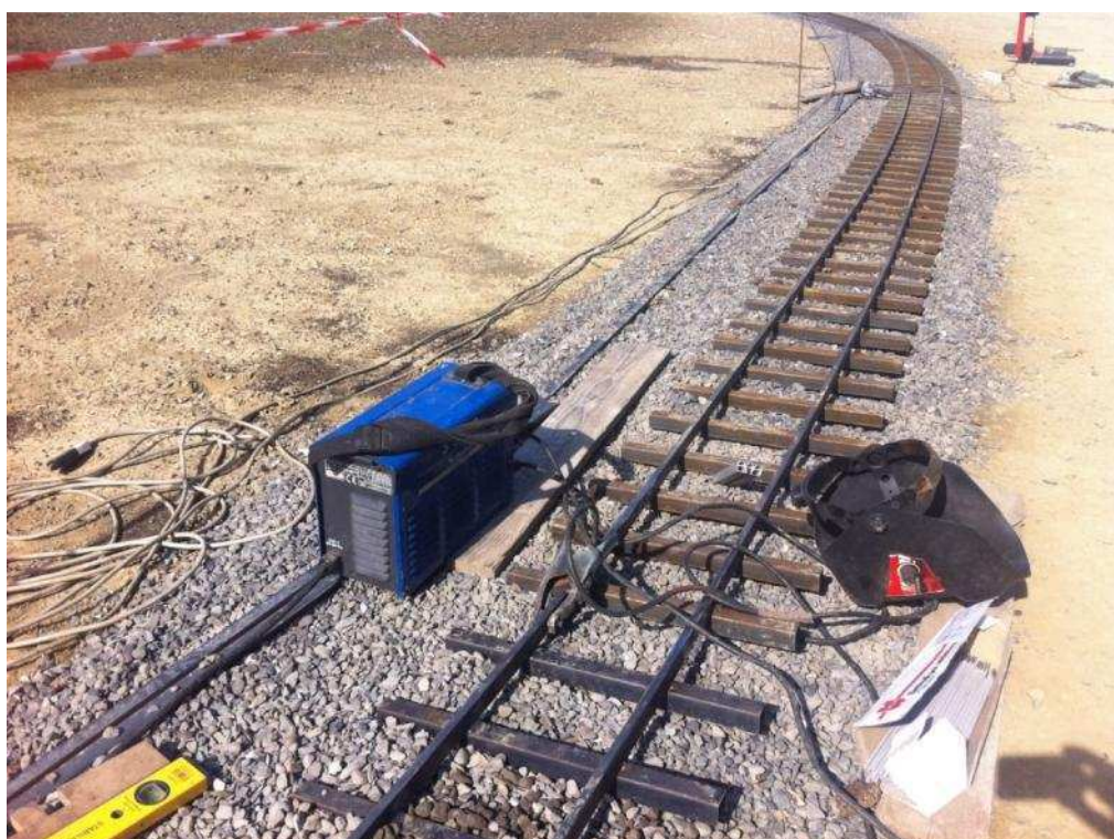
Figura 18 Binari curva Nord in fase di saldatura