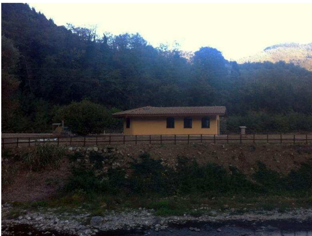
Figura 1/2/3/4 Viste del fabbricato con i muri pitturati , in attesa delle nuove gronde perché quelle installate in rame le hanno già rubate.