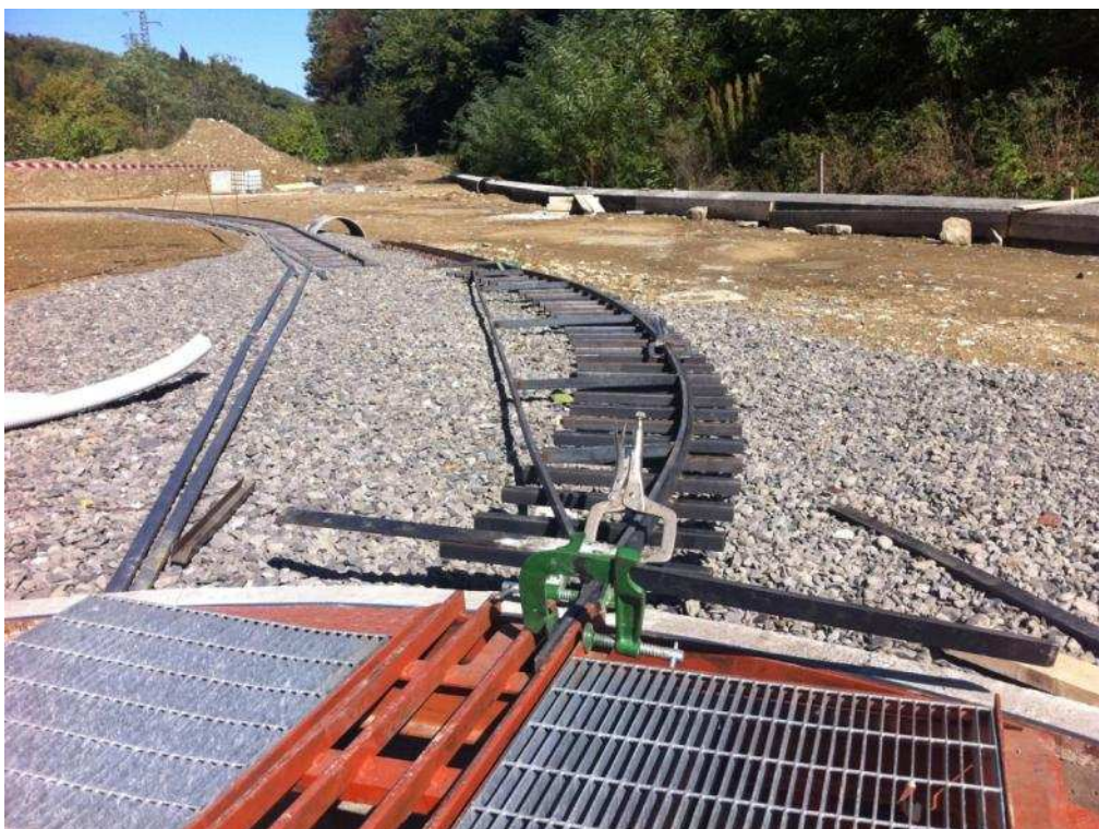
Figura 6 Raggio di curvatura 7500 mm.