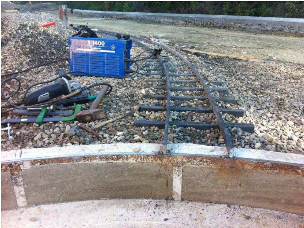
Figura 9 Binario già saldato alla piattaforma