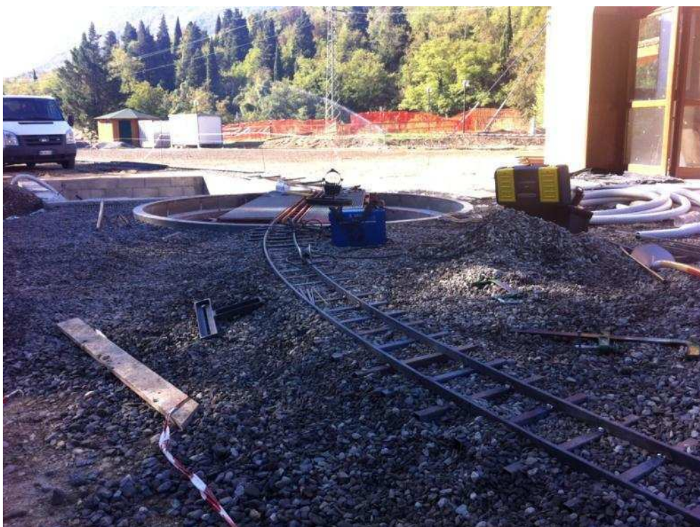
Figura 10/11/12/13/14/15/16 Lavori di saldatura dalla piattaforma alla curva Nord